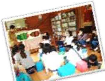
第1回おはなし会の様子

8月は小学生向けの内容になっています。夏休み中ですので、ぜひ参加してくださいね!