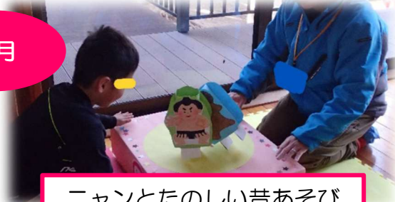
ニャンとたのしい昔あそび